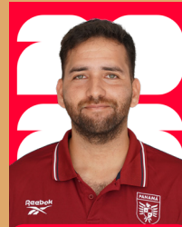
EDUARDO PINEL VIDEÓGRAFO