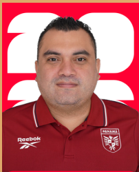
KELVIN FLORES VIDEÓGRAFO