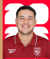
JAVIER GONZÁLEZ PRODUCCIÓN Y VIDEO