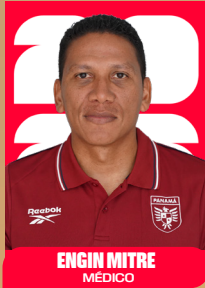
ENGIN MITRE MÉDICO