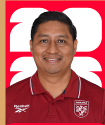
ALEXIS QUIROZ FOTÓGRAFO