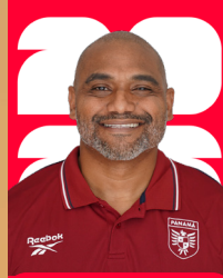
ELIECER AIZPRUA FOTÓGRAFO